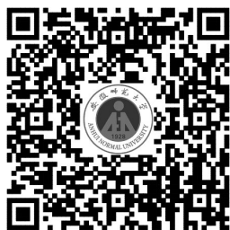
安徽师范大学官方微博二维码