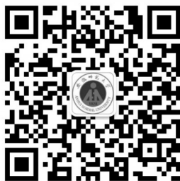
安徽师范大学官方微信二维码